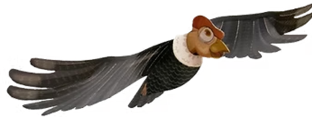
Lámina papercraft que se obsequiará a cada estudiante, con identificación de la empresa.